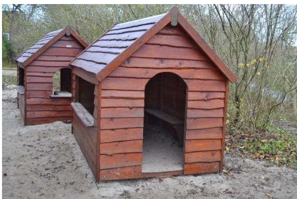
Redskab: Legehus Årgang: 2015 Producent: Rejstrup Savværk Er redskabet mærket: Ja Emne 1: Er der registreret fejl / mangler: Nej