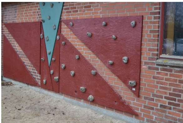
Redskab: Klatrevæg Årgang: 2004 Producent: Egen produktion Er redskabet mærket: Ja Emne 25: Er der registreret fejl / mangler: Nej