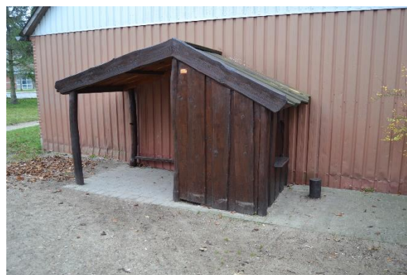
Redskab: Legehus Årgang: 2009 Producent: Danske legepladser Er redskabet mærket: Ja Emne 22: Er der registreret fejl / mangler: Ja