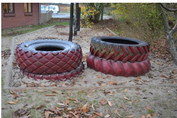
Redskab: Klatredæk Ikke omfattet af DS/EN 1176 Emne 8: