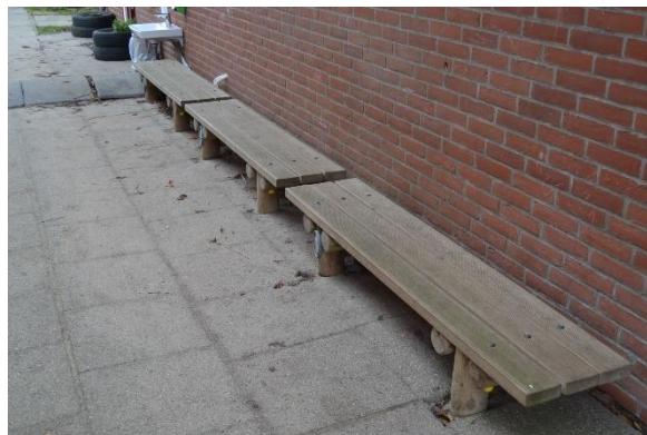
Redskab: Bænke sæt Ikke omfattet af DS/EN 1176 Emne 26: