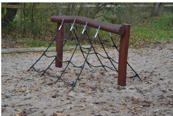
Redskab: Klatranæt Årgang: 2018 Producent: Bos legepladser Er redskabet mærket: Ja Emne 3: Er der registreret fejl / mangler: Nej