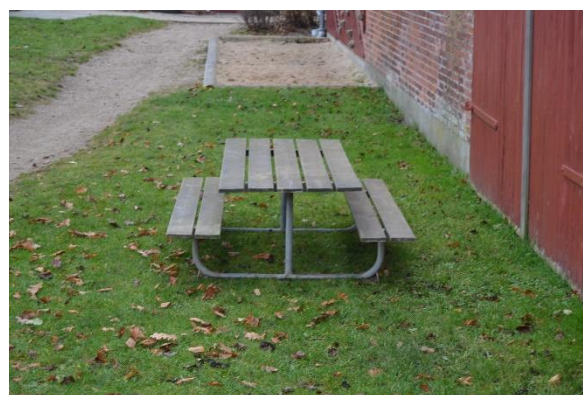
Redskab: Bordbænke sæt