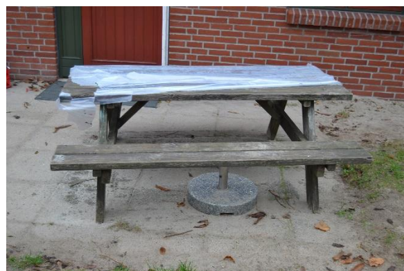
Redskab: Bordbænke sæt Ikke omfattet af DS/EN 1176 Emne 10: