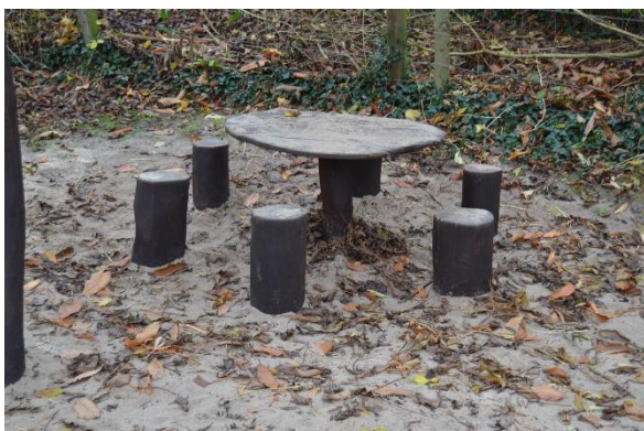
Redskab: Legebord Producent: Dica Er redskabet mærket: Ja Emne 7: Er der registreret fejl / mangler: Ja