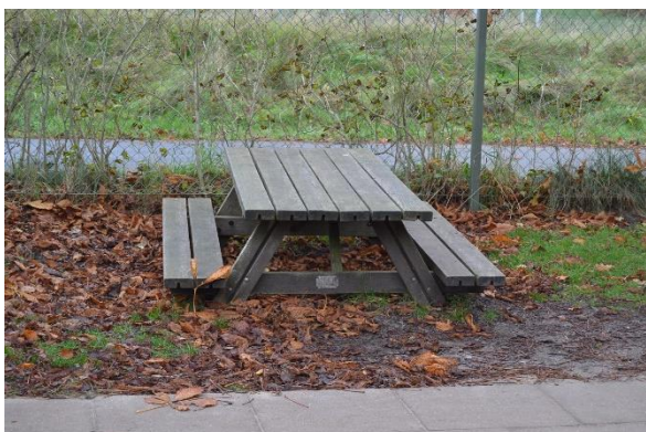
Redskab: Bordbænke sæt