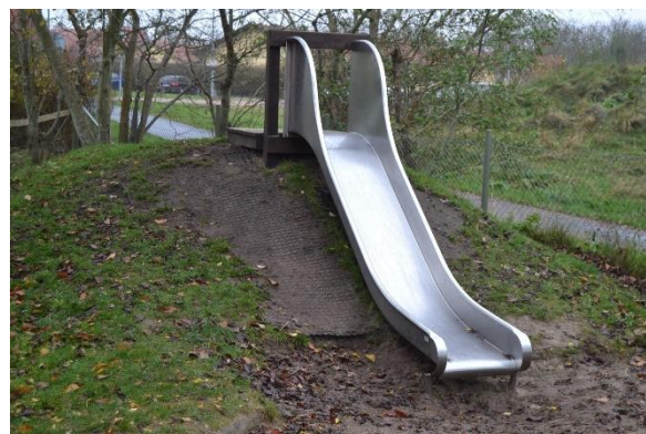
Redskab: Rutsjebane Årgang: 2004 Producent: R&T Er redskabet mærket: Ja Emne 4: Er der registreret fejl / mangler: Nej