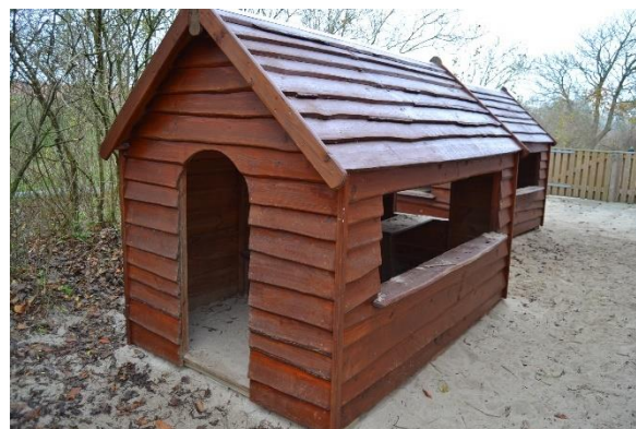
Redskab: Legehus Årgang: 2015 Producent: Rejstrup Savværk Er redskabet mærket: Ja Emne 2: Er der registreret fejl / mangler: Ja