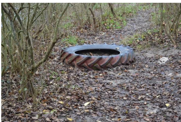
Redskab: Klatredæk Ikke omfattet af DS/EN 1176 Emne 5: