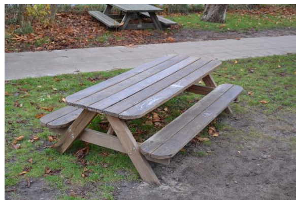
Redskab: Bordbænke sæt