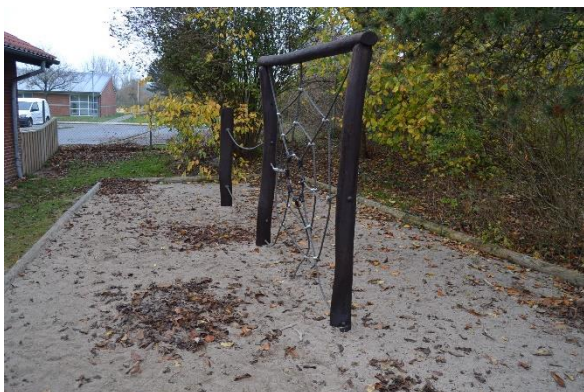
Redskab: Klatrenæt Producent: Er redskabet mærket: Ja Emne 11: Er der registreret fejl / mangler: Ja