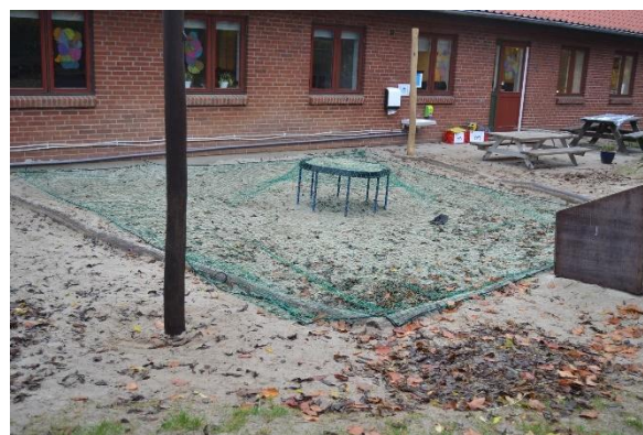
Redskab: Sandkasse Årgang: 2005 Producent: Danske Legepladser a/s Er redskabet mærket: Ja Emne 6: Er der registreret fejl / mangler: Nej