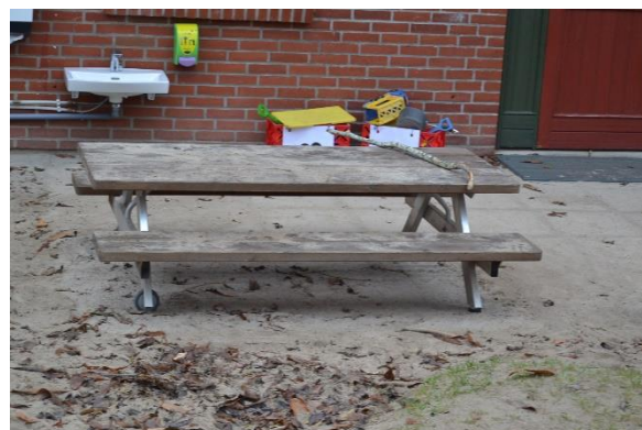
Redskab: Bordbænke sæt Ikke omfattet af DS/EN 1176 Emne 8: