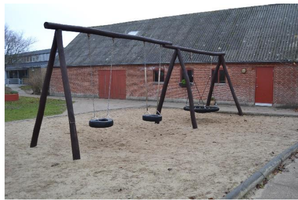
Redskab: Gynger Producent: Lekolar Er redskabet mærket: Ja Emne 12: Er der registreret fejl / mangler: Ja